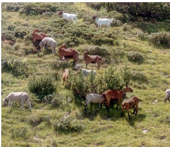
Ziegen im Farnboden Obersäss

keine Grasverluste durch den Weidetritt. Im Altsäss hatten wir mit dem Wasser kein Problem, im Farnboden – Obersäss war es eher knapp. Darum mussten wir die Herde in drei Gruppen aufteilen, damit sie sich auf verschiedene Tränken verteilten. Es hatte aber immer genügend Wasser für alle Tiere. In der Alp Wald hatten wir zu wenig Wasser. Im Bereich Wisliboden wo wir das Wasser mit dem Skihaus teilen, mussten wir einige Male Wasser mit Tanks zuführen. Zum Glück ist dort alles mit Strassen erschlossen, nicht wie zum Teil in anderen Alpen, wo das Wasser mit Helikoptern hingeflogen werden musste. Wenn das mit der Trockenheit so weitergeht, muss man in nächster Zeit in zusätzliche Reservoirs investieren.