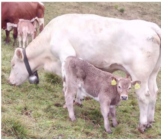
Mutterkuh mit Kalb auf der Alp Legi