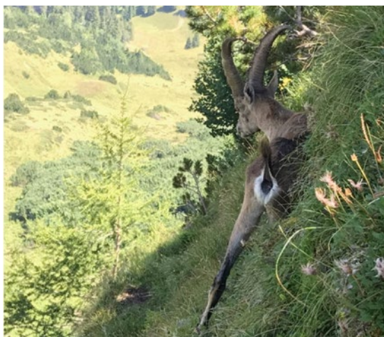
Steinbock gesehen auf dem Glännli