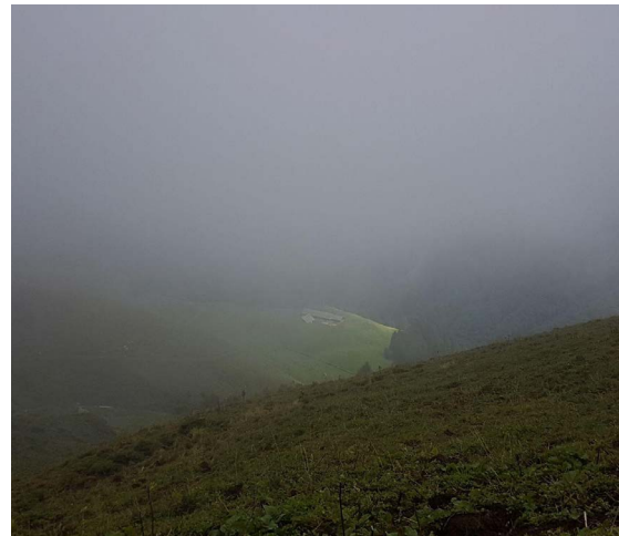
Neblicher Blick zum Altsäss – Untersäss

schneit bis in tiefe Lagen. Darauf folgten für den Jahresabschluss ein schöner Herbst und ein schneereicher Dezember. In den Alpen liegt zurzeit sehr viel Schnee, was ein grosser Vorteil ist für die Wasservorräte und für den kommenden Alpsommer sein kann. Das Ausmass der allfälligen Sturm- oder Lawinenschäden wird sich erst im Frühjahr zeigen. Wir hoffen, dass sie nicht allzu gross sind.