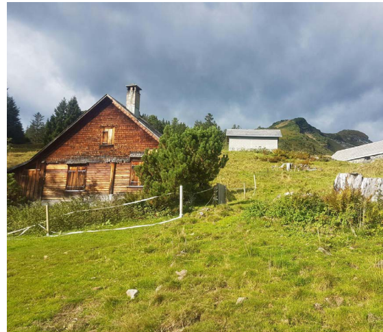
Gewitterstimmung im Farnboden – Obersäss