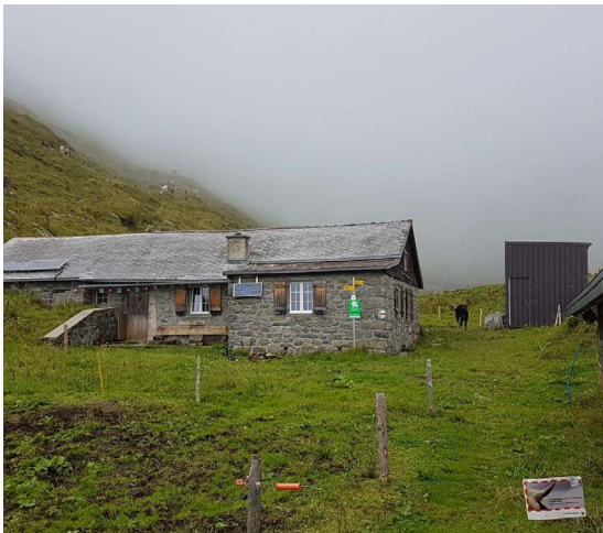
Typisches Bild vom Altsäss – Obersäss im Nebel