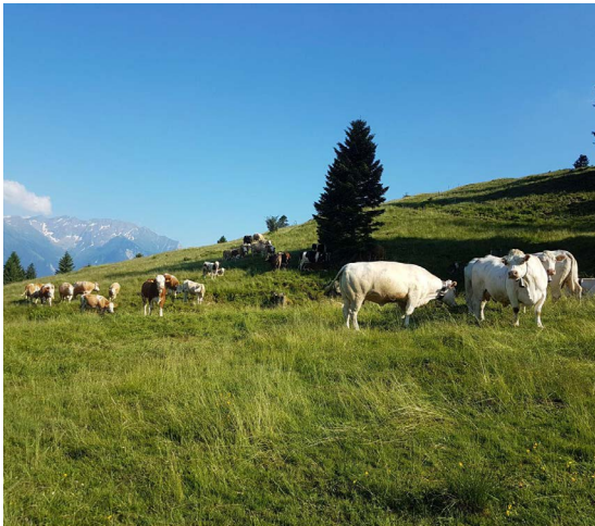
Die Mutterkühe weiden zufrieden auf der Alp Legi