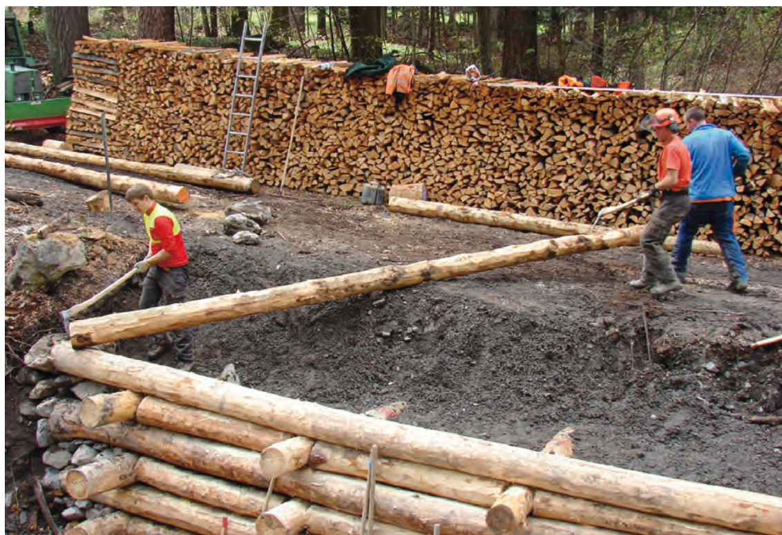
Holzkasten erstellt durch GRABUS