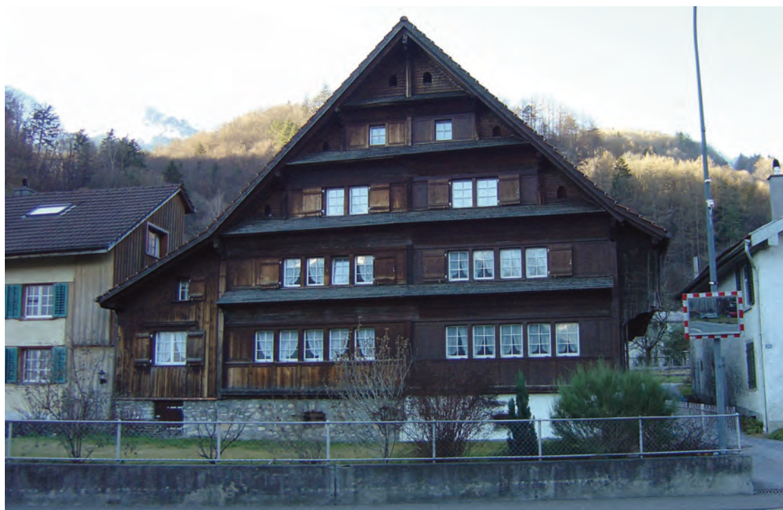
Haus Zimmerli Histengass 72/74

An der Wiesenstrasse sind alle Parzellen verkauft. Zu verkaufen sind noch die Parzellen in der Brigglä.