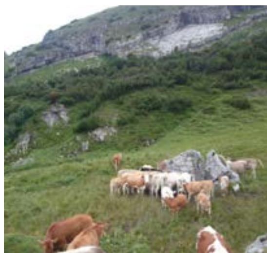
Kaum ist der neue Brunnentrog installiert, wird er schon rege benutzt. (Bim Rettigsschlitta zwüschet Farnboda Obersäss und Glanna.)