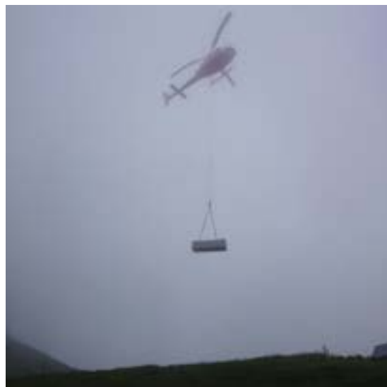
Materialtransport fürs Wasserprojekt.