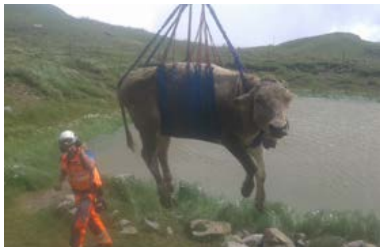
Tierbergung von der Glanna mit dem Helikopter.

Im Altsäss endete für den Hirten die Alpseason schon Mitte Juli, weil er im steilen Gelände ausrutschte und somit verunfallte. Durch den Sturz hat er sich den Meniskus und die Kreuzbänder gerissen. Dies hiess für mich, dass