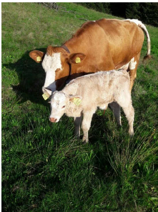
Kalb Alp Legi