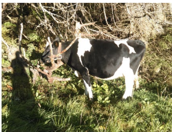
Rind Alp Wald